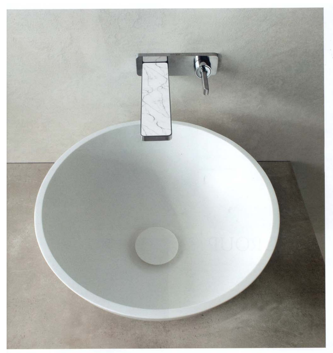
Sopra, elegante miscelatore della collezione completa e personalizzabile GZero. La cover è disponibile in 12 varianti, tra cui marmo bianco di Carrara (nella foto), Corian, pietra, acciaio inox e vetro cristallo. Nella pagina accanto, in alto, due miscelatori della linea Sprint Color, che si distingue per il rivestimento del comando realizzabile in 12 materiali tra cui il marmo (a sinistra) e il legno (al centro). Sotto, miscelatore dalle forme lineari sofisticate della serie GX, disponibile in 3 altezze e 3 versioni.